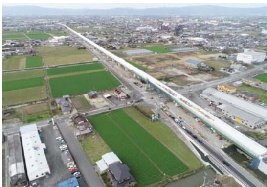
大川東IC (大川高架橋)