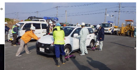
昨年度の出動式及び移動訓練状況