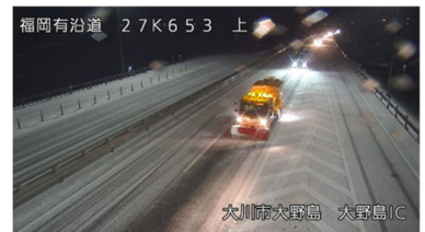
【昨年度の出動式及び移動訓練状況】