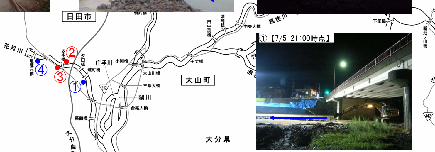
<応急復旧工事の状況>