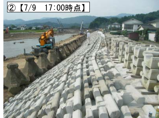
<応急復旧工事の状況>