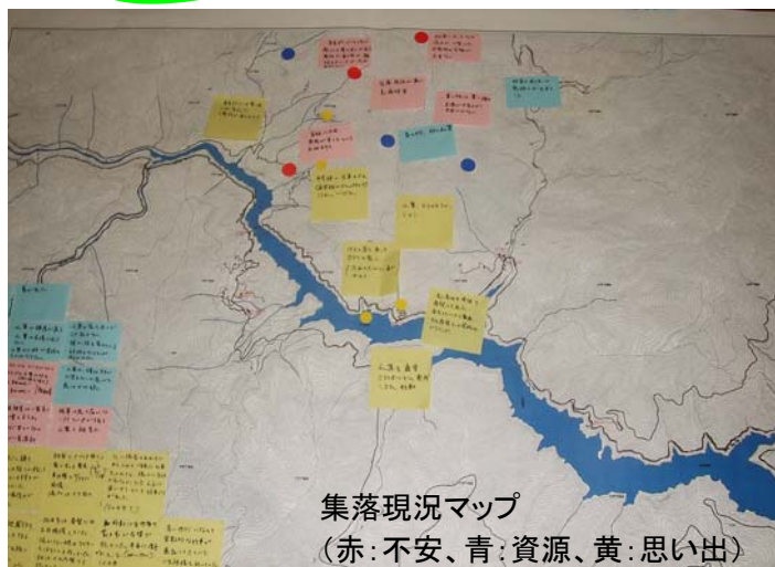
集落現況マップ (赤:不安、青:資源、黄:思い出)