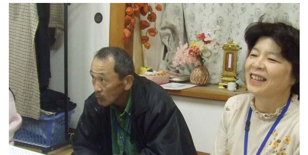
ワークショップでの和気あいあいとした話し合い