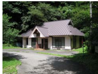
集落内に集会所があるが、今では寄り合いもなく、集会所は利用されていない。

集落の特徴： 瀧春山、松木、横野、上福良の4集落で尾八重地区を形成している。地区内の小学校が閉校し、瀧春山集落の若年世帯の一部は子どもの教育のために同じ地区内の横野集落に他出している。