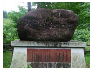
椎葉の里の労働歌として、鶴富姫と那須大八郎の悲恋の物語として古くから尾八重集落で歌い継がれている。昭和49年に村指定文化財に指定。