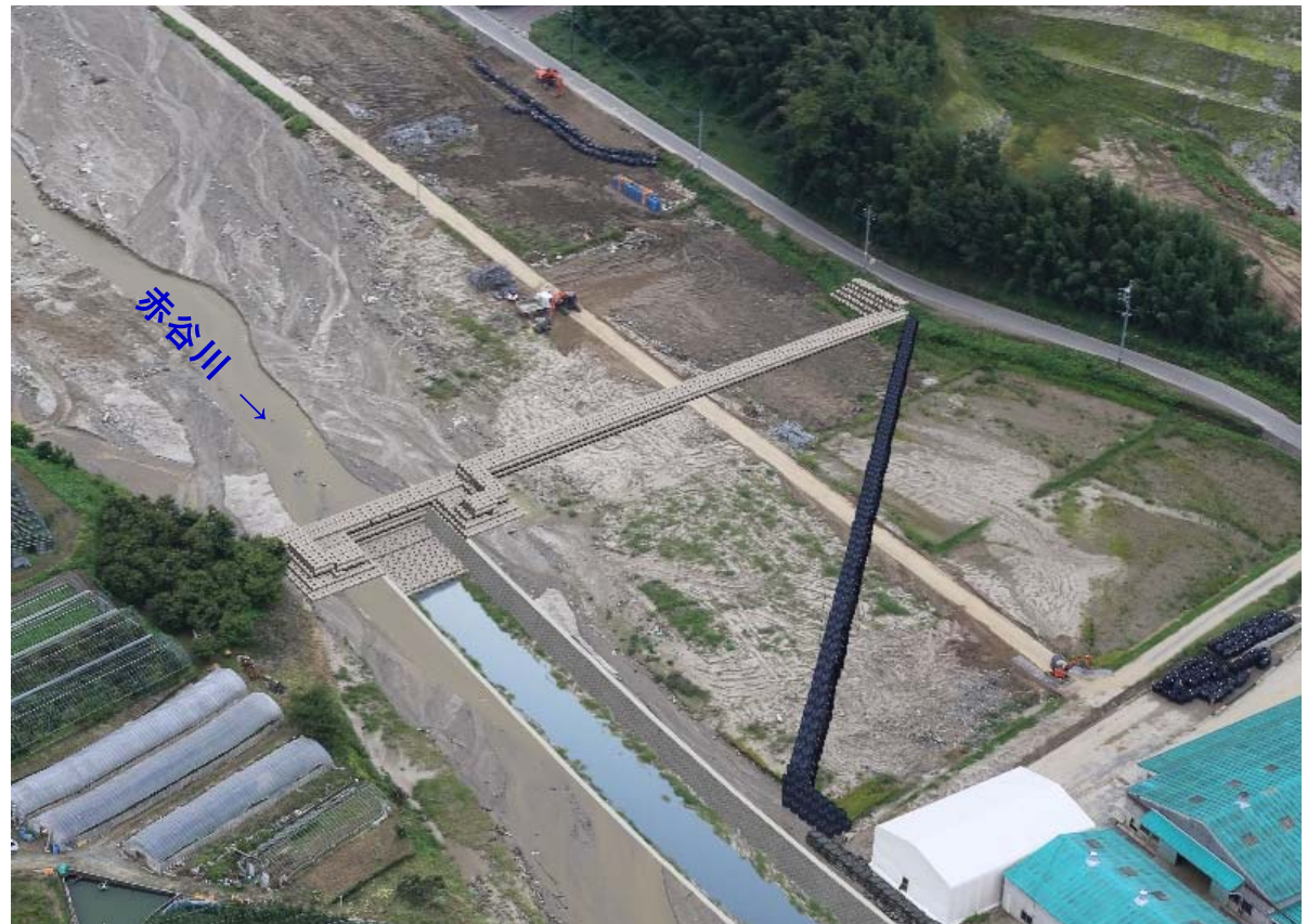
■1号土砂止め工の完成イメージ■