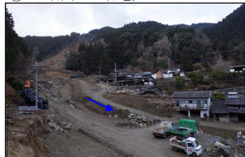
③ 大山川 大山地区