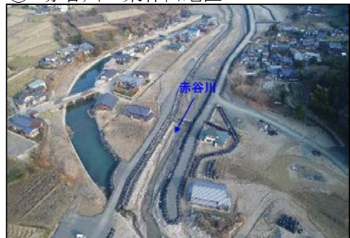
② 乙石川 乙石地区