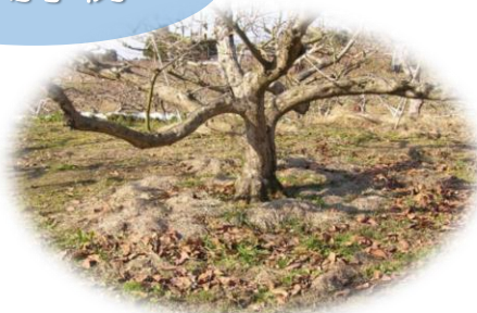
果樹園・茶畑の敷草