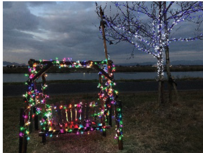
【イルミネーション：合川緑地】