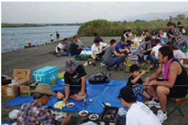
【バーベキューセットの貸し出し：くるめウス前河川敷】