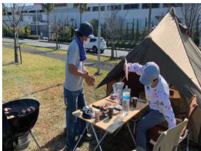
【BBQセットの貸し出し：合川緑地】