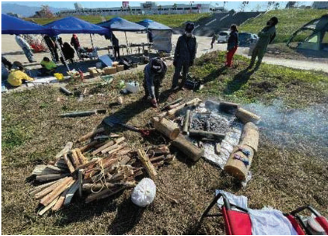
【竹工作体験：宮ノ陣河川敷】