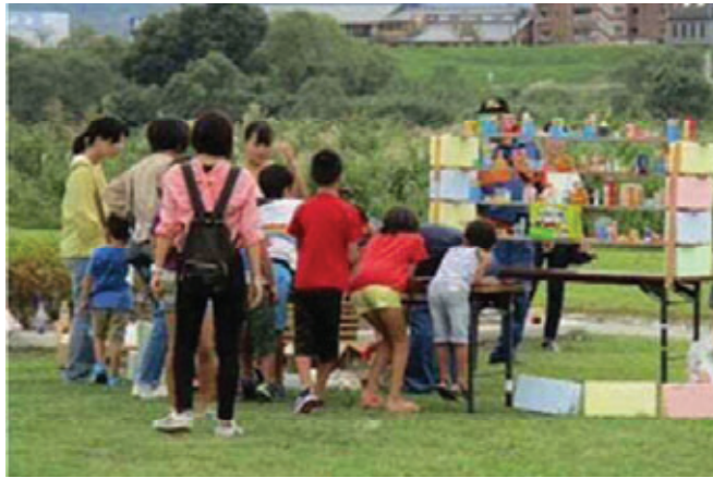
【射的：宮ノ陣河川敷】