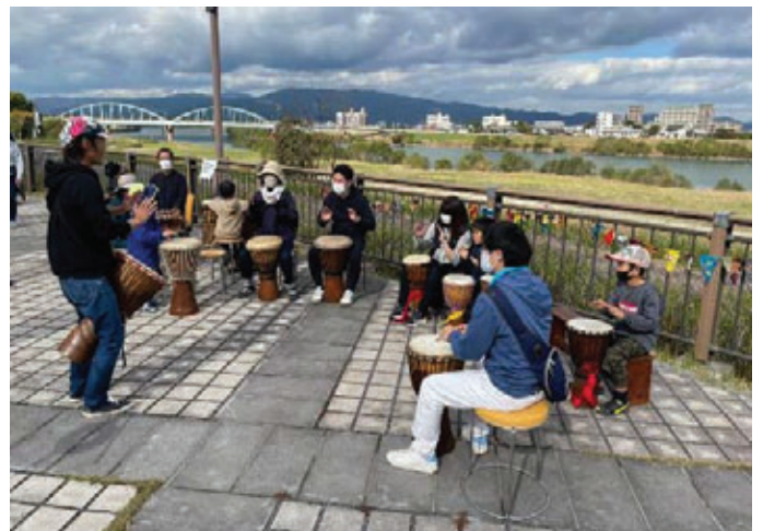
【野外コンサート(体験型イベント「川の日2021」 ：くるめウス前河川敷】