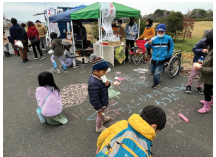
【天端で絵描き体験：くるめウス周辺】