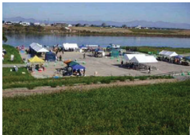
【様々なイベントと飲食の提供 （リバークルーフエスティバル）：くるめウス前河川敷】