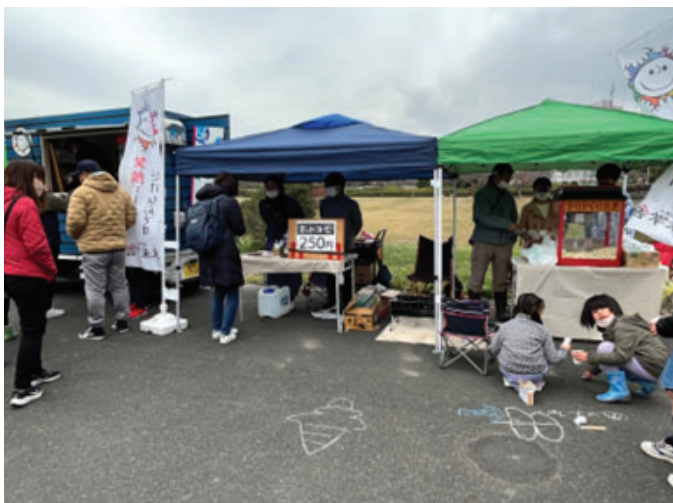
【キッチンカー：くるめウス周辺】