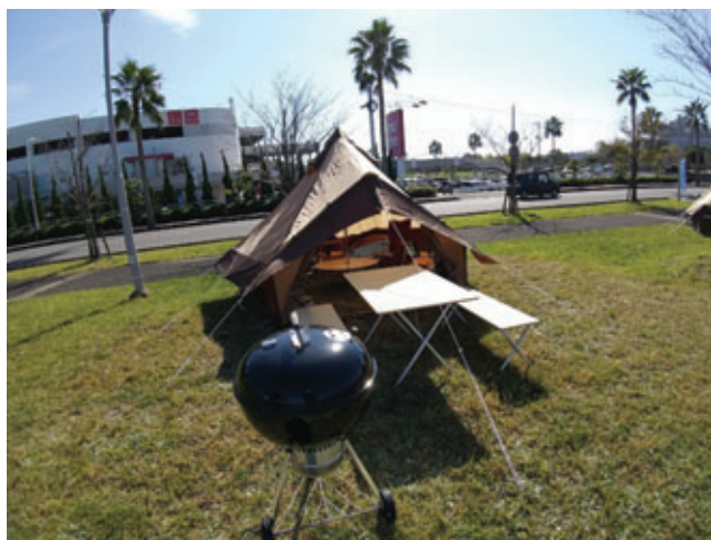
【グランピング：合川緑地】