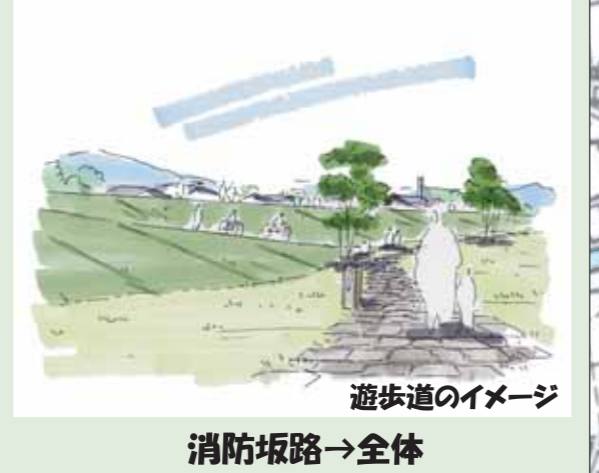
遊歩道のイメージ 消防坂路→全体