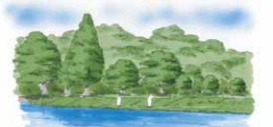
淵の再生イメージ