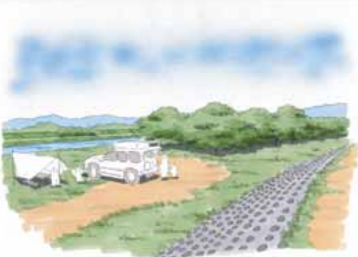
キャンプ場のイメージ