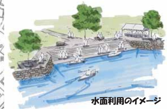
水面利用のイメージ