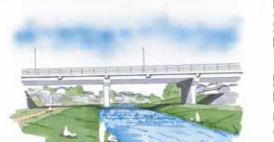
水際を自然にした整備イメージ