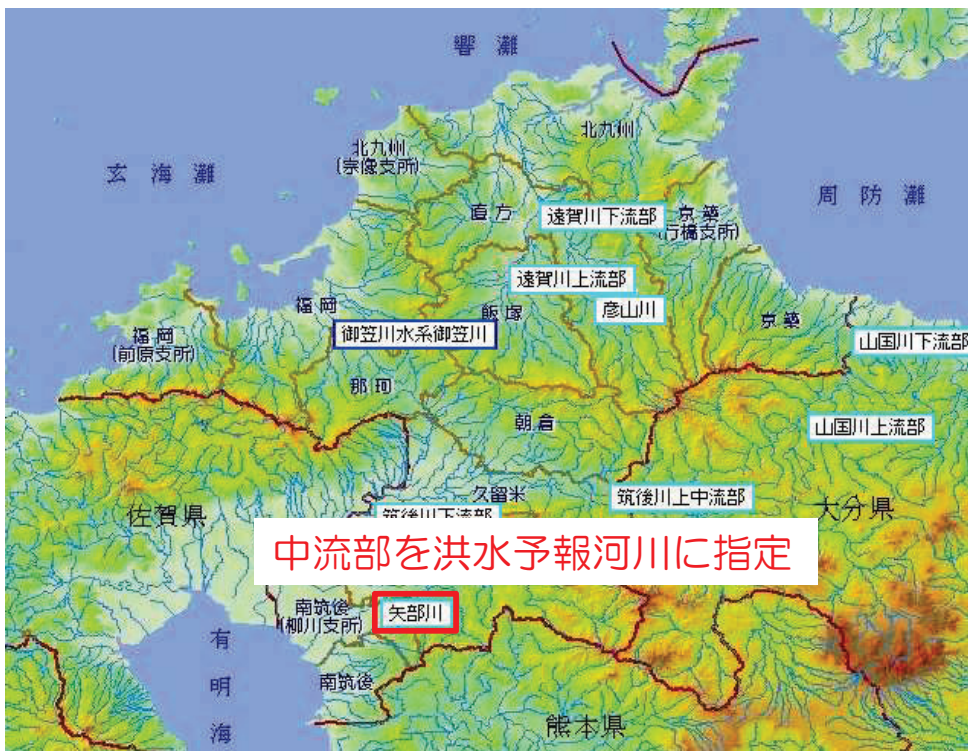
県内の洪水予報河川