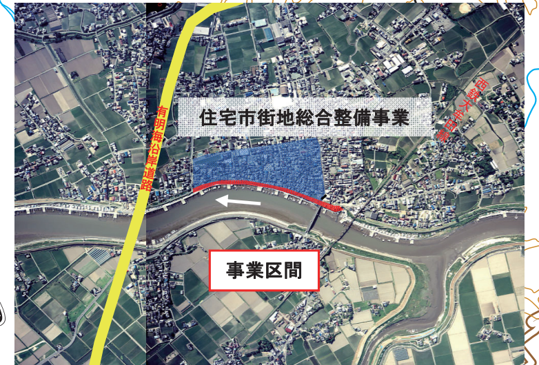
①中島地区高潮対策事業