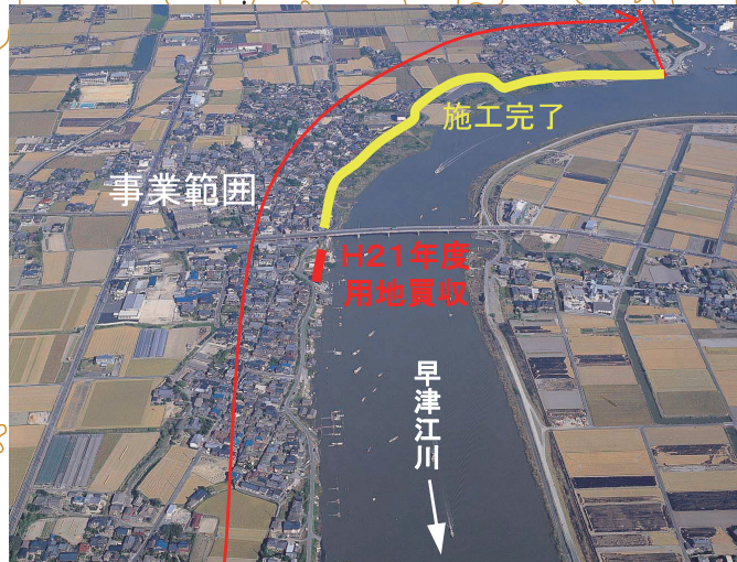
④早津江川(早津江)地区高潮対策事業