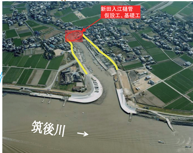
②新田入江地区高潮対策事業