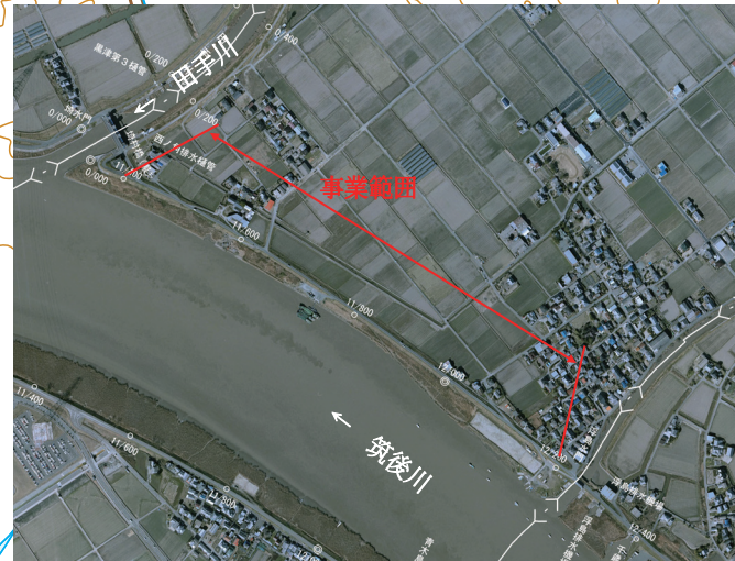
⑤浮島地区堤防と道路の一体整備