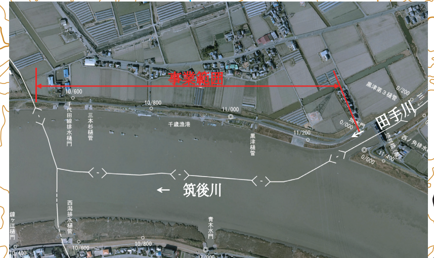
⑥黒津地区堤防と道路の一体整備