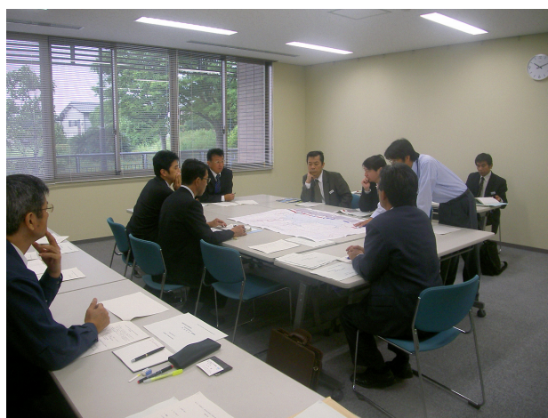
写真 4.1.1 高潮対策連絡協議会の開催状況

このことから関係機関が連携して河口域の海岸・高潮堤防の整備にむけて情報共有・整備進捗が図れるよう平成 21 年度より『有明海沿岸高潮対策連絡協議会』を開催し、事業調整等図りながら進めていくこととしています。