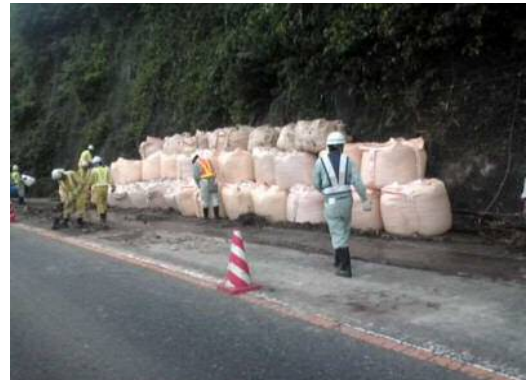
平成24年7月14日発生災害