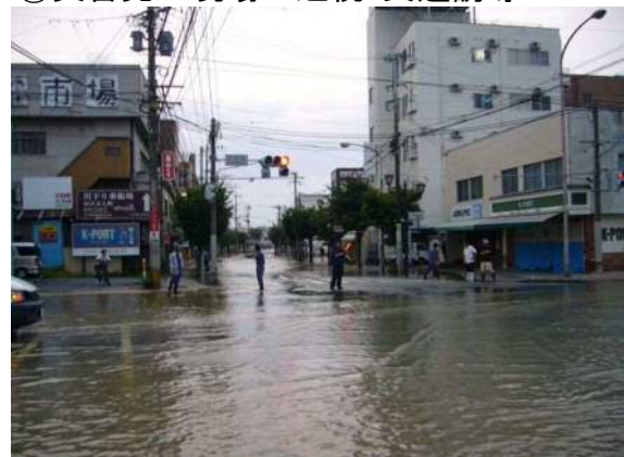
平成24年7月14日発生災害