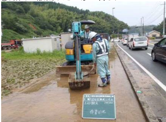
平成24年7月14日発生災害