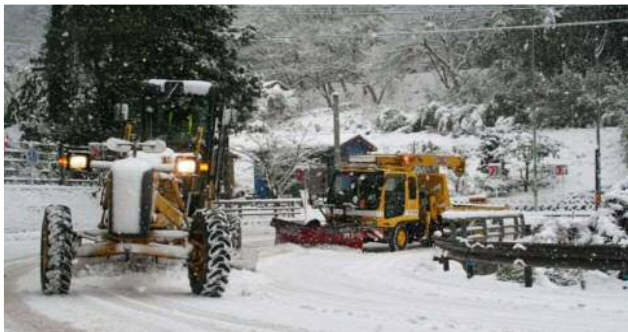
平成28年1月24日発生災害