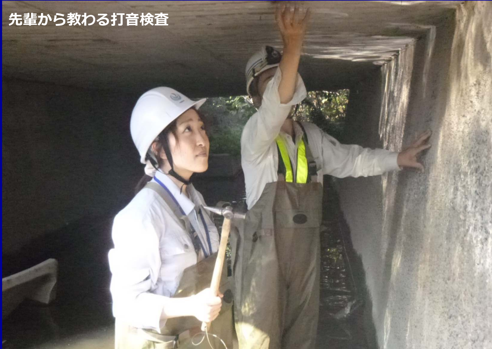
先輩から教わる打音検査

コンクリートの表面をハンマーで叩いたときに反響する音の高さやその際の感覚により、コンクリートの劣化などの異常を検知する点検手法です。