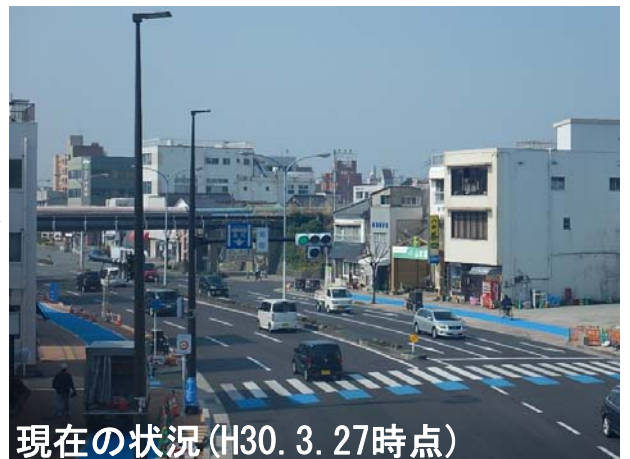
※旭町横断歩道橋より熊本県境側を望む