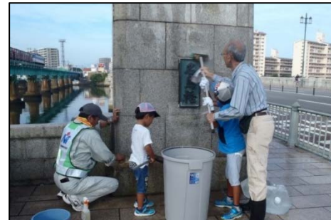
▲ 地域住民による親柱の清掃

平成6年以降、毎年8月4日(橋の日)の前後に地域住民の方々や、福岡国道事務所職員等が参加し、名島橋とその周辺の国道3号の清掃活動を実施