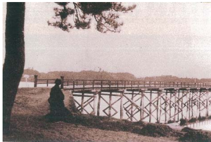
▲2代目 名島橋(大正時代)