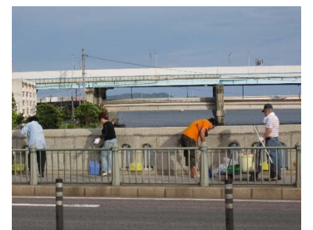
▲ 地域住民による歩道の清掃