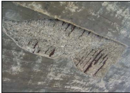
▲ 損傷状況(剥離・鉄筋露出)