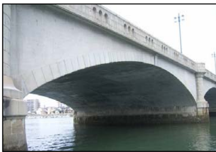
▲ 大規模修繕事業 完了後