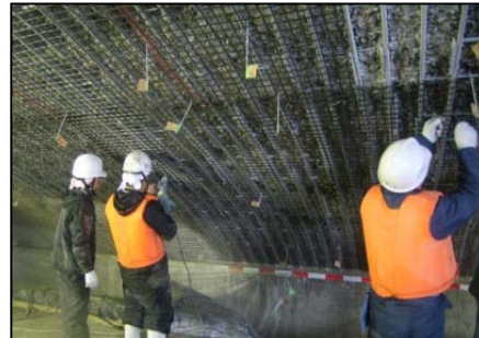
▲ 大規模修繕事業 補修状況