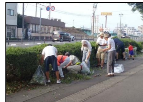
▲ 地域住民による植栽の剪定・除草