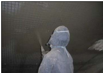
▲ 大規模修繕事業 補修状況