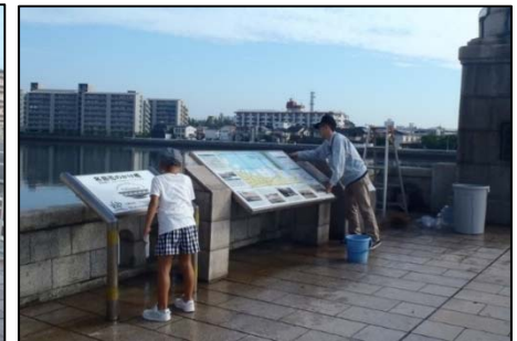
▲ 地域住民によるパネルの清掃