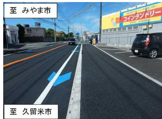
完成した歩道と自転車通行空間