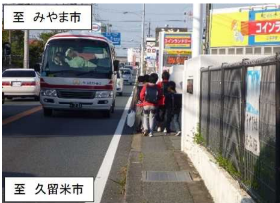
狭い歩道を通学する小学生