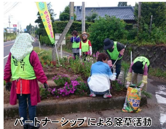
パートナーシップによる除草活動