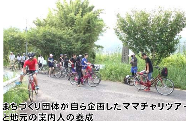
まちづくり団体が自ら企画したママチャリツアー と地元の案内人の養成