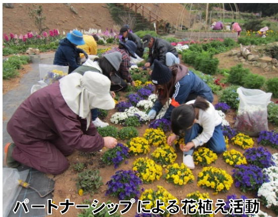
パートナーシップによる花植え活動