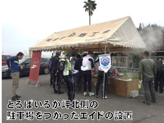
とるばいるか岬北側の 駐車場をつかったエイドの設置