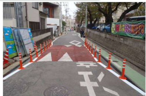
福岡市中央区平尾地区(平成29年11月実証実験)

可搬型ハンプ(仮設)は、国土交通省九州地方整備局より技術支援の一環として無償で借り受けます。