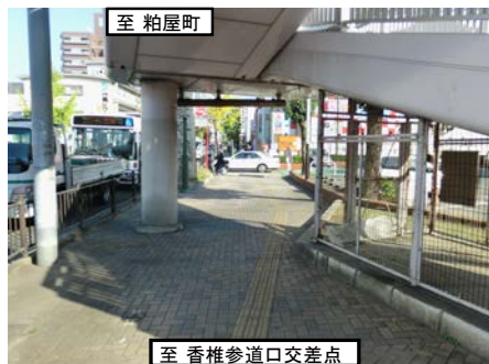
横断歩道橋の橋脚による狭い歩道