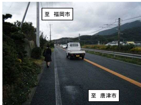
国道202号の狭隘な歩行空間を通学する中学生