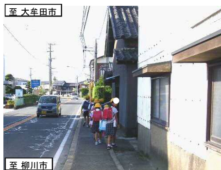
狭い歩道を通学する小学生