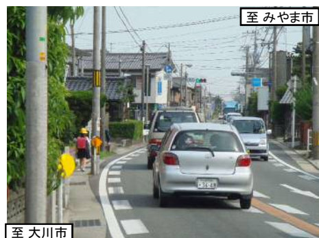
歩道が無いので狭い路肩を通行する小学生