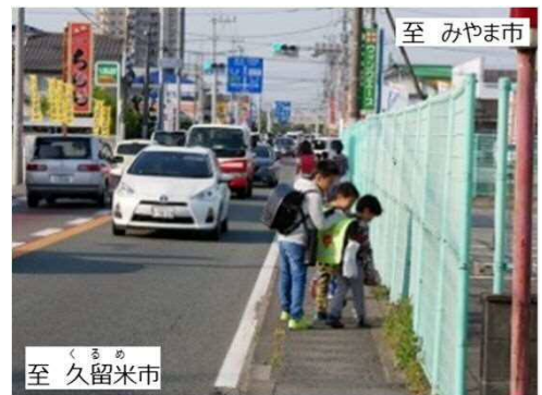
国道209号の狭隘な歩行空間を通学する小学生