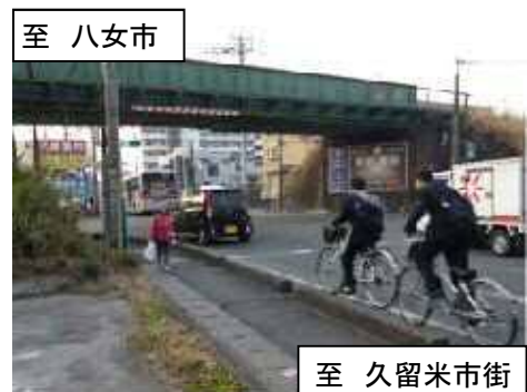
国道3号の狭隘な歩行空間を通学する児童や自転車