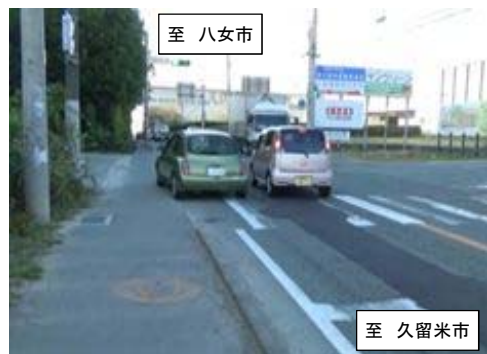
右折待ち車両を避けて直進する後続車