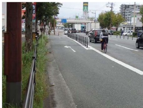
車道を走行する自転車(すれ違い時の衝突リスク)