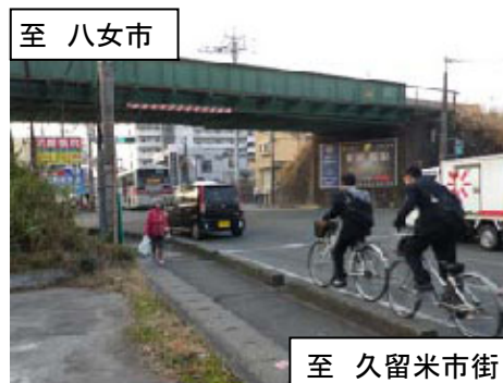
国道3号の狭隘な歩行空間を通学する児童や自転車