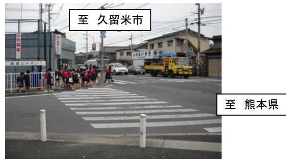
国道3号の狭隘な交差点の歩行者溜まりで信号待ちする児童