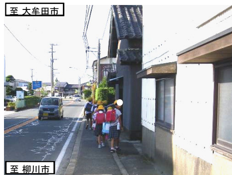
狭い歩道を通学する小学生