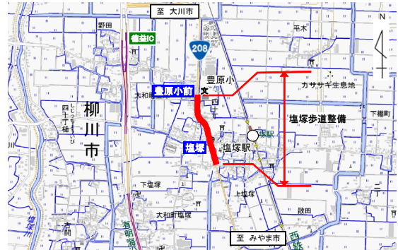
「この背景地図等データは、国土地理院の電子国土Webシステムから配信されたものである。」