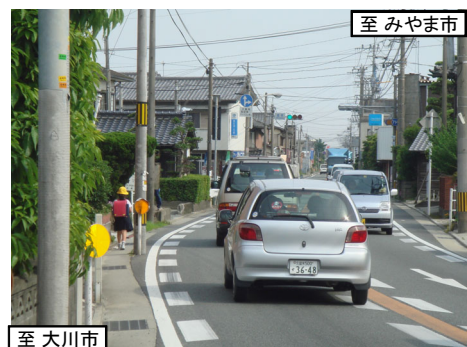
歩道が無いので狭い路肩を通行する小学生