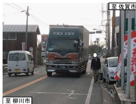
歩道がないため路肩を通行する歩行者