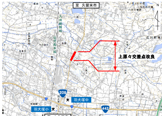
「この背景地図等データは、国土地理院の電子国土Webシステムから配信されたものである。」