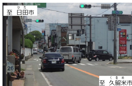
国道210号の歩道が未整備状況