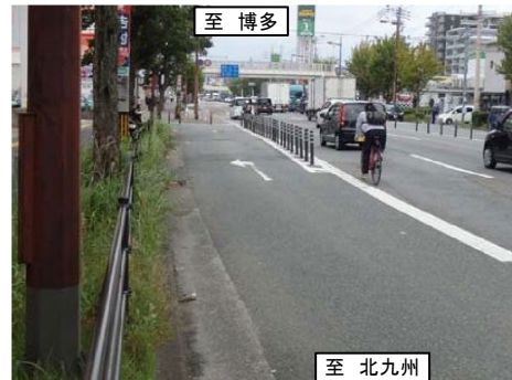
車道を走行する自転車(すれ違い時の衝突リスク)