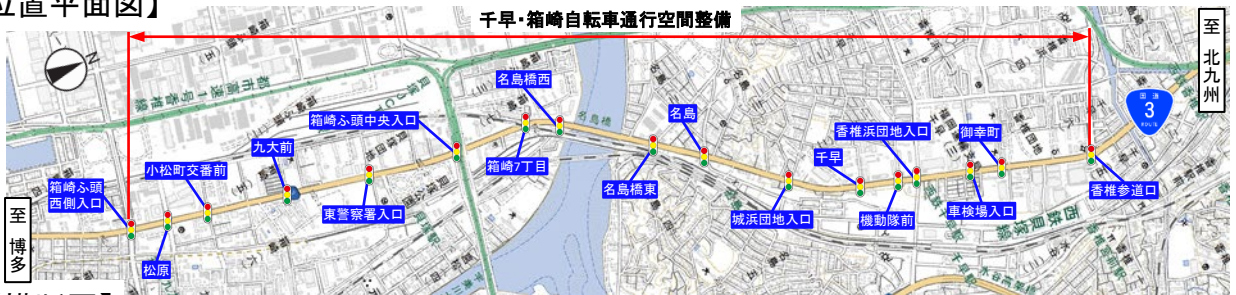
【横断図】「この背景地図等データは、国土地理院の電子国土Webシステムから配信されたものである。」