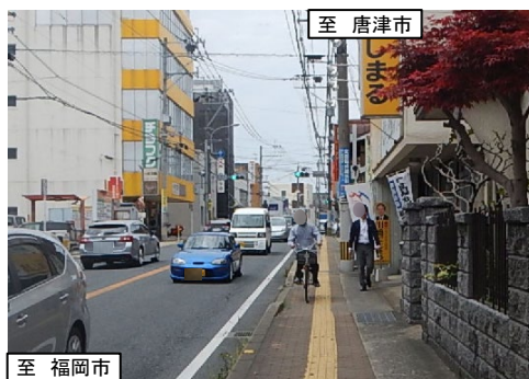
国道202号の狭い歩行空間を通行する歩行者