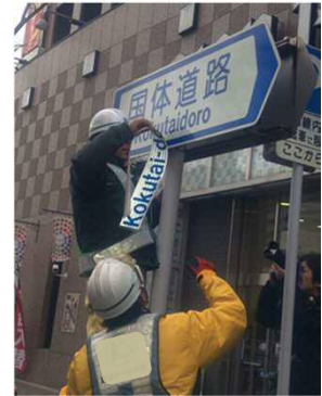
[試行区間での施工状況]

この先行改善路線のうち国体道路の ぎおんまちにし 祇園町西交差点から わたなべどおり 渡辺通4丁目交差点間(約900m)について、以下の日時に道路案内標識の変更作業に着手します。