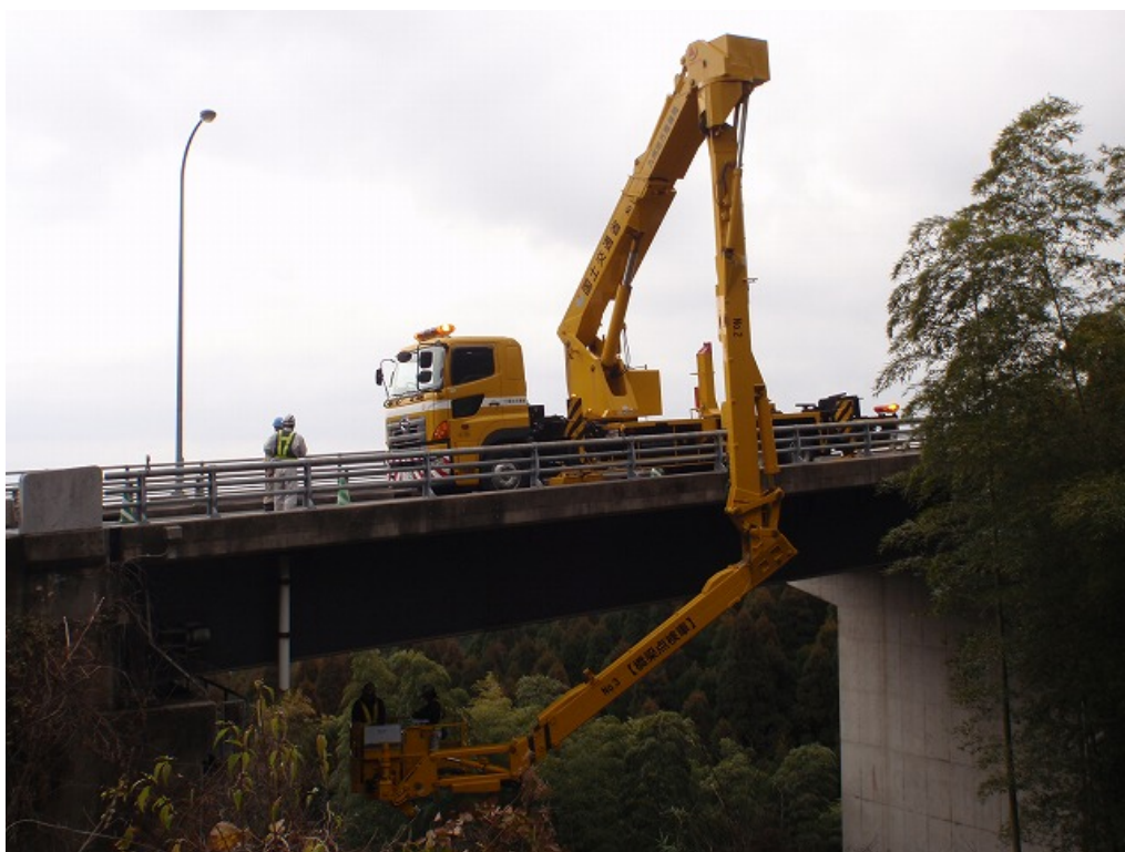
橋梁点検車による近接状況調査 作業状況