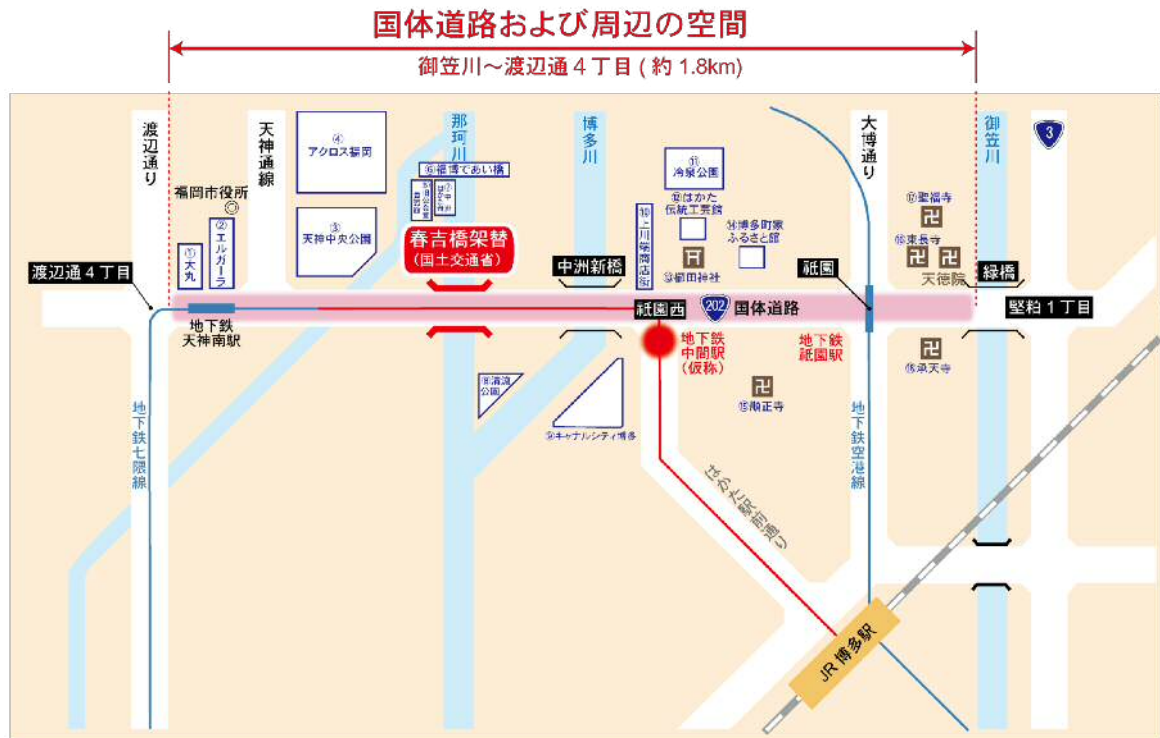
図-1 国体道路および周辺の空間イメージ図(御笠川～渡辺通4丁目)