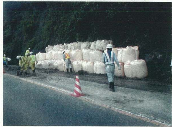
平成24年7月14日発生災害