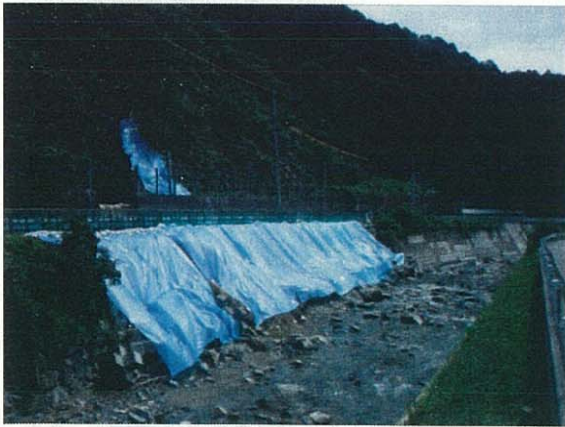
平成21年7月24日発生災害