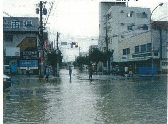
平成24年7月14日発生災害