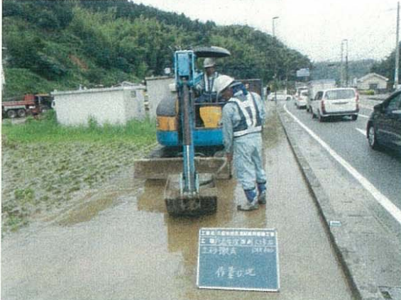
平成24年7月14日発生災害