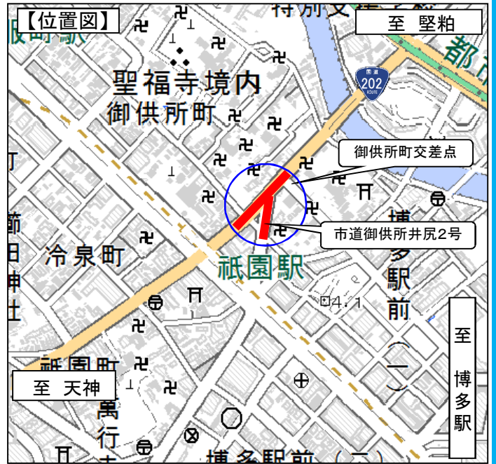
※この地図は、国土地理院発行の2万5千分の1地形図を使用したものである。