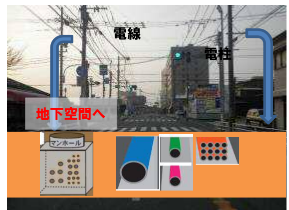
【現況】国道208号大川市酒見地区

工事は、交通量の少ない夜間に実施していますが、工事に伴う騒音及び振動が発生するため、沿線の皆様にご迷惑をかけていますが、きれいな街並みにするためご理解ご協力の程、宜しくお願い致します。