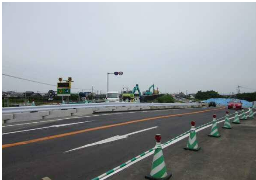
【施工状況】国道209号筑後市野町地区

※ 工事期間中は、皆様に大変ご迷惑をお掛けしますがご理解とご協力をお願い致します。