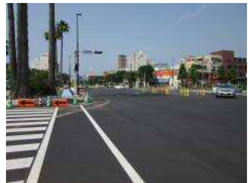
【施工状況】国道208号大牟田駅前交差点