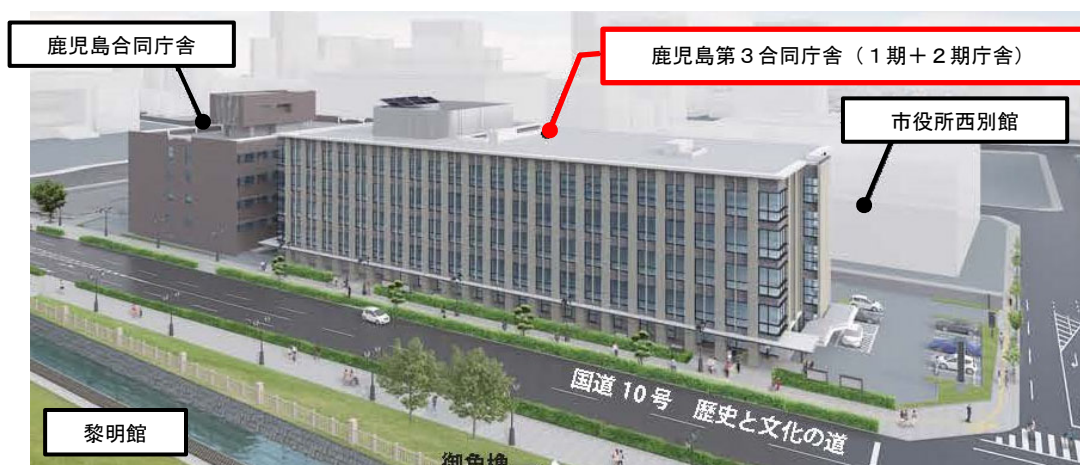
完成予想図（令和5年8月完成予定）