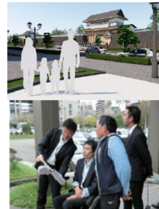
図面、画像及び現地確認で説明