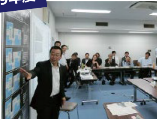
実物大の庁舎案内板を説明