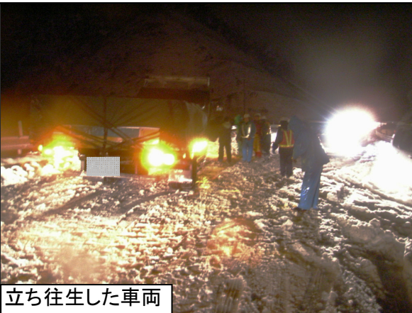
立ち往生した車両