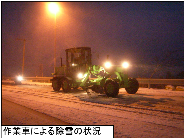
作業車による除雪の状況