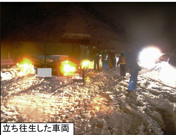
立ち往生した車両