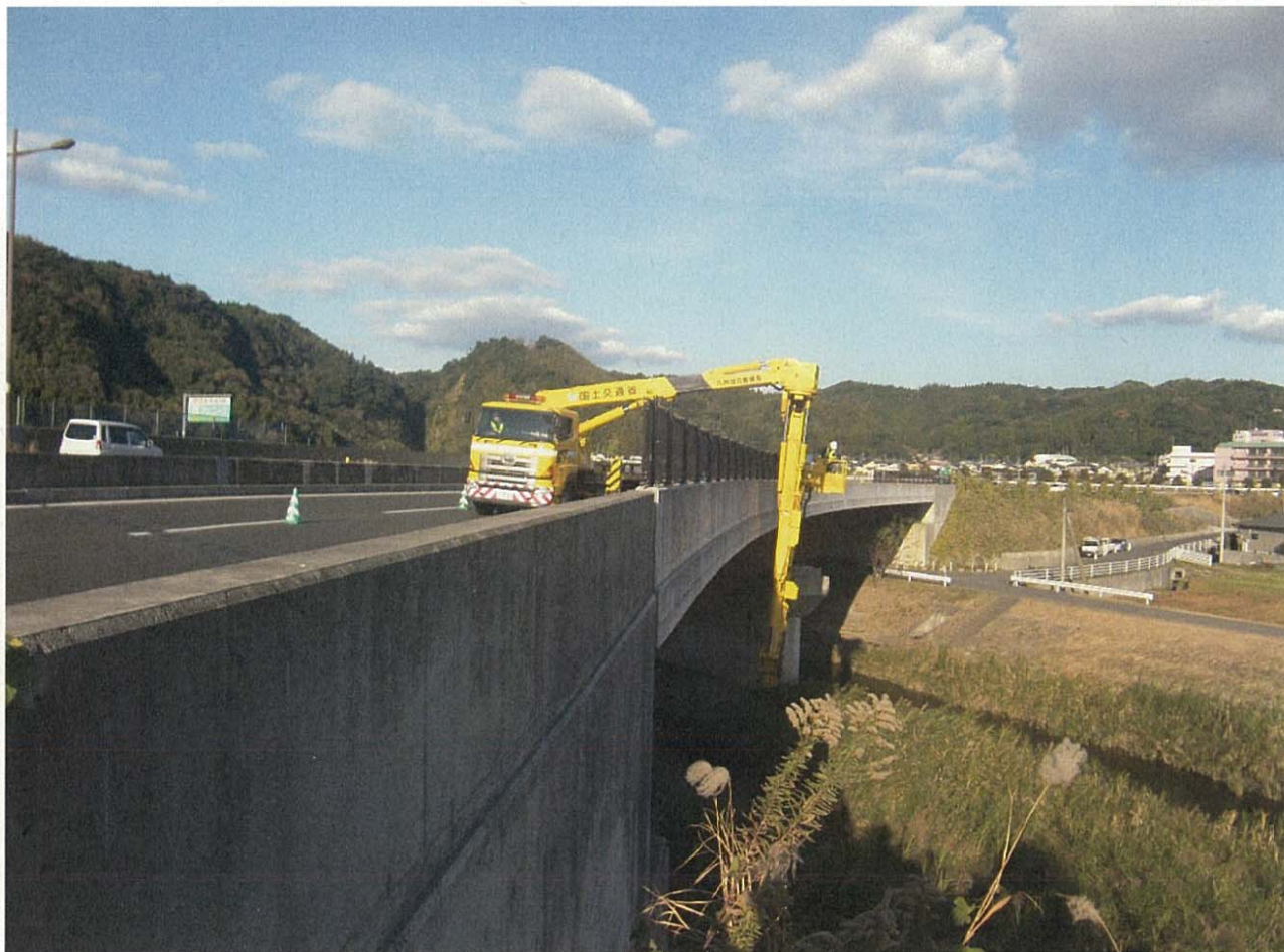
写真 橋梁点検車による定期点検状況(イメージ)