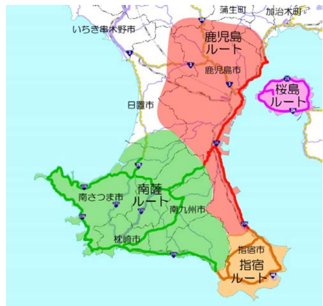
かごしま風景街道ルート図